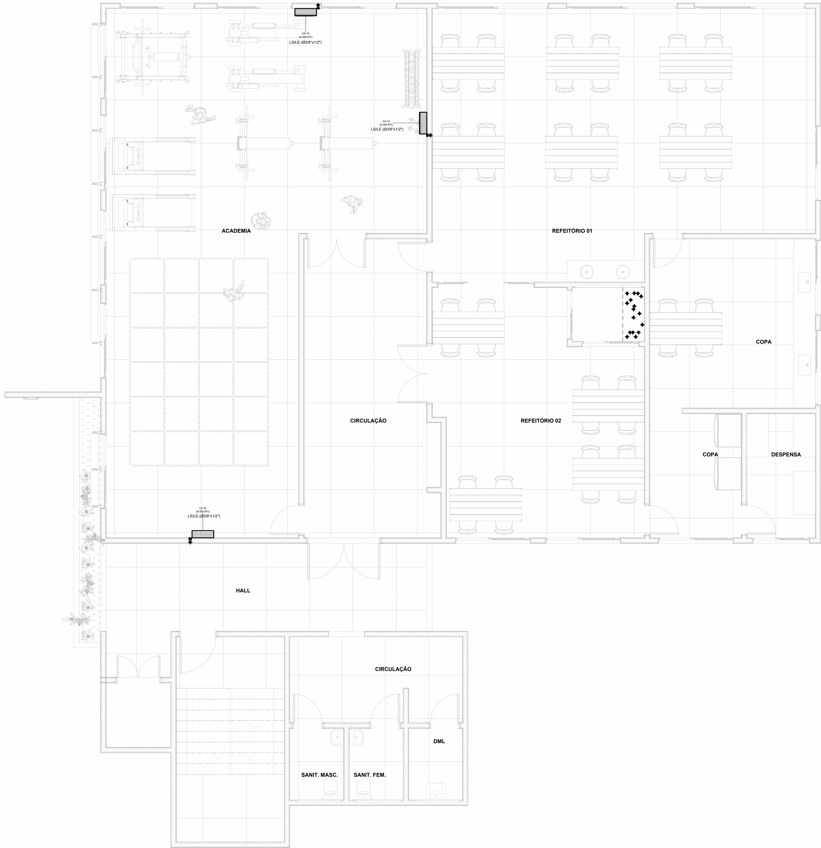
1 BP Caatinga - 2º ANDAR 1 : 50